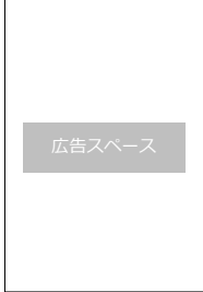
<中面／コンテンツ選択>