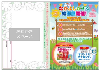
<表まわり／春夏秋冬ver.>