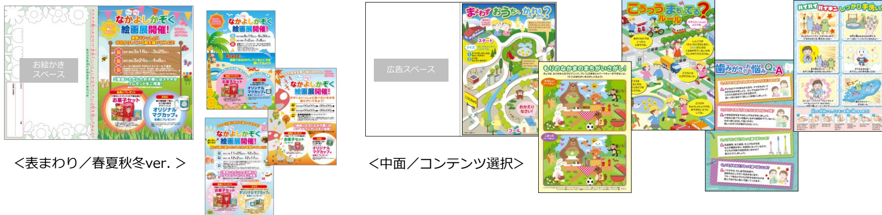
<表まわり／春夏秋冬ver.>